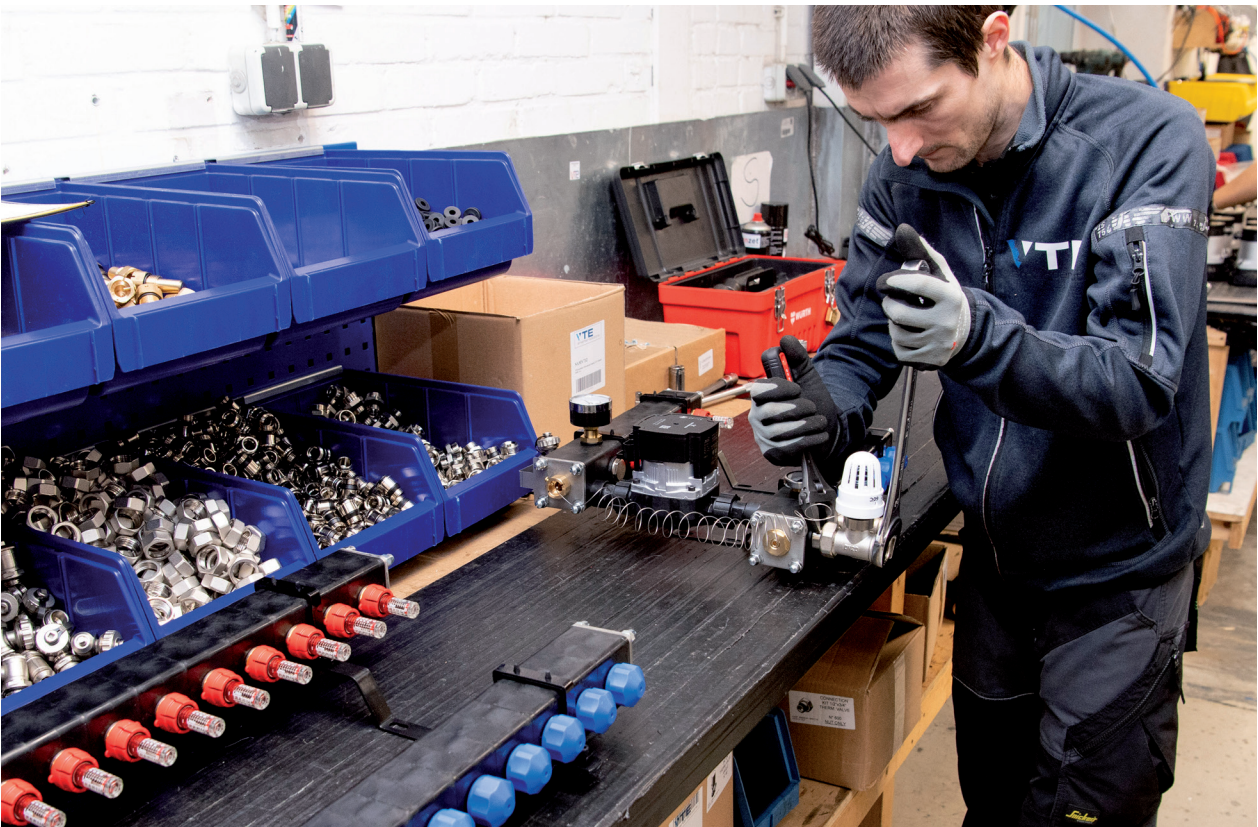
Tekst: Tekst: Bob de Jong

Met deze nieuwe composietverdeler is VTE Smartersolutions er in geslaagd om met een waardevolle toevoeging aan het toch al omvangrijke gamma te komen. Marcel Jansen: “We zijn ervan overtuigd dat het een succes wordt. Voor dat je een nieuw product in de markt zet, moet je uiteraard wel je huiswerk doen. Dat is hier gebeurd. En mede daarom volop vertrouwen in deze nieuwe verdeler. Die vindt zijn weg wel.” ■